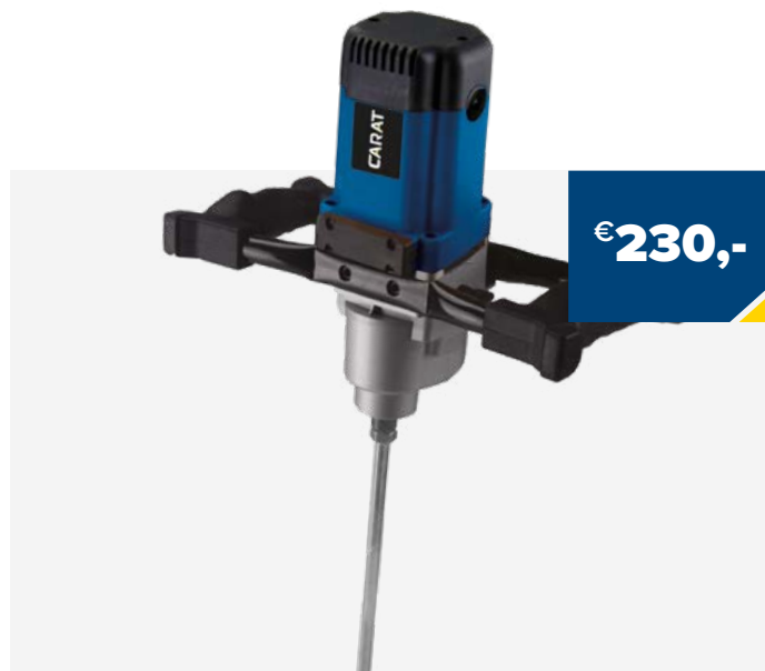
Art. Nummer BUI0020000 HANDMIXER TYPE 1900