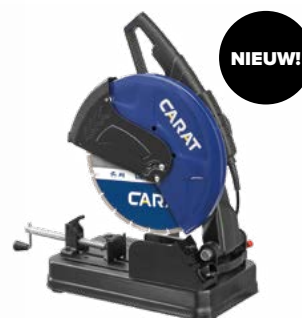
EasyCoup Compact 350