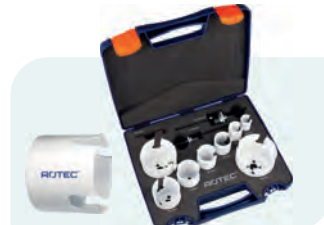
10-dlg. MP-gatzagenset met Quick-Lock "Elektricien" Type 528 1x ø22, 27, 35, 38, 44, 51, 68 en 76mm