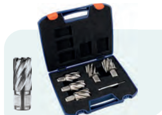
6-dlg. HSS kernborensset SILVER-LINE 30mm (Weldon), in kunststof koffer Type 536W 1x ø24, 26, 28, 30 en 32mm