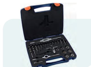
26-dlg. machinetap- en snijplaatset, metrisch [M], in kunststof koffer M3, M4, M5, M6, M8, M10 en M12