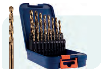
19-dlg. HSS-E spiraalborenset in ABS-cassette Type 116, geslepen 1x \phi 1 - 10 / 0,5\text{mm} oplopend