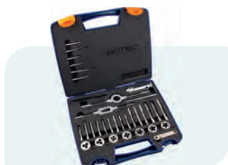
33-dlg. handtap- en snijplaatset, metrisch [M] in kunststof koffer M3, M4, M5, M6, M8, M10 en M12