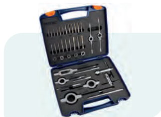
55-dlg. handtap- en snijplaatset, metrisch [M] in kunststof koffer M3, M4, M5, M6, M8, M10, M12, M14, M16, M18 en M20