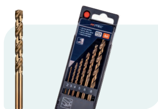
6-dlg. HSS-E spiraalborenset in PVC-cassette Type 111, geslepen 1x \phi 2, 3, 4, 5, 6 en 8mm