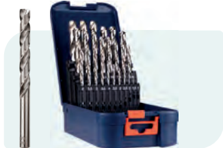
25-dlg. HSS-G spiraalborenset in ABS-cassette Type 105, geslepen 1x \phi 1 - 13 / 0,5\text{mm} oplopend