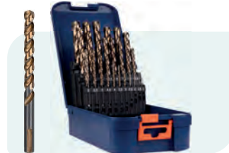
25-dlg. HSS-G spiraalborenset in ABS-cassette Type 107, geslepen 1x \phi 1 - 13 / 0,5\text{mm} oplopend