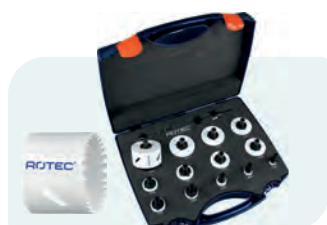
16-dlg. BiMCo gatzagenset (4/6) met Quick-Change "Allround" 6-knt. 11 Type 527 1x ø19, 22, 25, 32, 35, 38, 44, 51, 57, 60, 64, 68 en 76mm