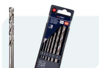
6-dlg. HSS-G spiraalborenset in PVC-cassette Type 105, geslepen 1x \phi 2, 3, 4, 5, 6 en 8mm