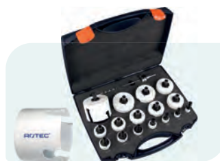
19-dlg. MP-gatzagenset met Quick-Change "Max" 6-knt. 11 Type 528 1x ø19, 22, 25, 29, 32, 35, 38, 44, 51, 57, 60, 64, 68, 76, 83 en 92mm