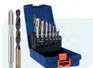
7+7-dlg. HSS-E machinetappenset, doorlopend, in ABS-cassette, 'OPTI' (320): DIN 371: M3 - M10; DIN 376: M12. 'PRECISE' (101) 1x \phi 2,5 / 3,3 / 4,2 / 5,0 / 6,8 / 8,5 / 10,2 mm