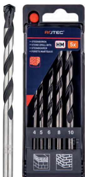
5-dlg. steenborenset in PVC-cassette Type 225 1x \varnothing 4, 5, 6, 8 en 10mm