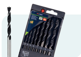
8-dlg. houtspiraalborensset in PVC-cassette Type 235 1x ø3, 4, 5, 6, 7, 8, 9 en 10mm