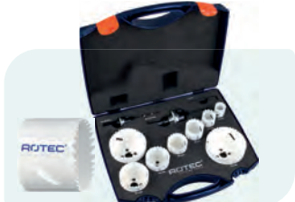
10-dlg. HSS-BiMCo8 Gatzagenset (4/6) met Quick-Lock "Elektricien" Type 527 1x ø22, 27, 35, 38, 44, 51, 68 en 76mm