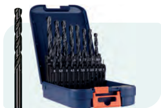
19-dlg. HSS-R spiraalborenset in ABS-cassette Type 100, rolgewalst 1x \phi 1 - 10 / 0,5\text{mm} oplopend