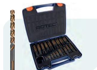
170-dlg. HSS-G spiraalborenset in kunststof koffer Type 107, geslepen 10x \phi 1 - 8 / 0,5\text{mm} oplopend 5x \phi 8,5 - 10 / 0,5\text{mm} oplopend