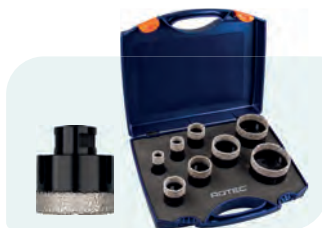
8-dlg. M14 diamantboorkronen-set, in kunststof koffer Type 757 1x ø20, 25, 32, 35, 40, 50, 60 en 68mm