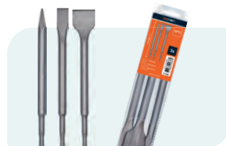
Beitelset Triple OPTI-LINE Type 214 1x SDS+ Puntbeitel, 250mm 1x SDS+ Plattebeitel, 20x250mm 1x SDS+ Spadebeitel, 40x250mm