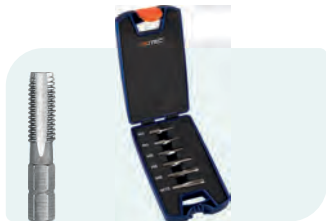
6-dlg. HSS-G tapbitset, metrisch [M], in ABS-cassette Type 317 1x M3, M4, M5, M6, M8 en M10