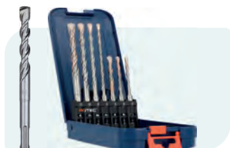
7-dlg. hamerborenset, SDS-plus, V-Breaker, in ABS-cassette type 200 1x ø5, 6 en 8x110; 1x ø6, 8, 10 en 12x160