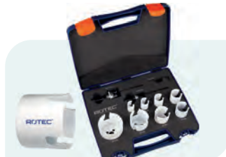
10-dlg. MP-gatzagenset met Quick-Lock "Loodgieter" Type 528 1x ø19, 22, 27, 32, 35, 40, 51 en 64mm