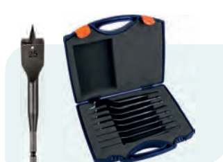
8-dlg. speedborensset Heavy-Duty in kunststof koffer Type 233 1x ø12, 14, 16, 18, 20, 22, 25 en 32mm