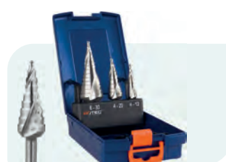
3-dlg. HSS trappenborenset in ABS-cassette Type 425 1x Nr. 0/9, 1 en 2