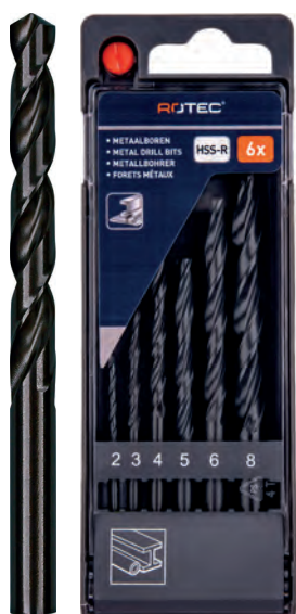
6-dlg. HSS-R spiraalborenset in PVC-cassette Type 100, rolgewalst 1x \varnothing 2, 3, 4, 5, 6 en 8mm

Diverse uitvoeringen in handige en compacte PVC-cassettes