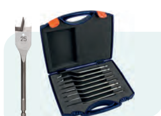
8-dlg. speedborensset in kunststof koffer Type 230 1x ø12, 14, 16, 18, 20, 22, 25 en 32mm