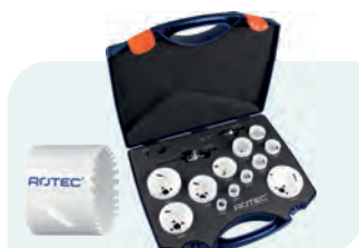
14-dlg. BiMCo8 gatzagenset (4/6) met Quick-Lock "Allround" Type 527 1x ø19, 22, 25, 32, 35, 38, 44, 51, 57, 64, 68 en 76mm