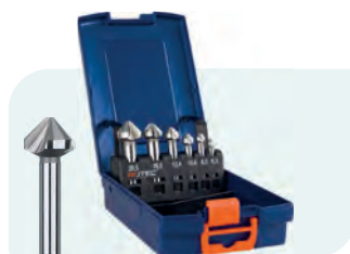
6-dlg. HSS-G verzinkfrezenset in ABS-cassette Type 400 1x \phi 6,3 / 8,3 / 10,4 / 12,4 / 16,5 / 20,5mm