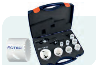
10-dlg. HSS-BiMCo8 gatzagenset (4/6) met Quick-Lock "Loodgieter" Type 527 1x ø19, 22, 27, 32, 35, 40, 51 en 64mm