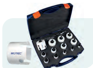
16-dlg. MP-gatzagenset met Quick-Change "Allround" 6-knt. 11 Type 528 1x ø19, 22, 25, 32, 35, 38, 44, 51, 57, 60, 64, 68 en 76mm