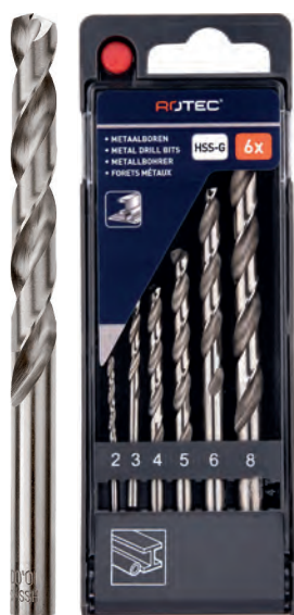
6-dlg. HSS-G spiraalborenset in PVC-cassette Type 105, geslepen 1x \varnothing 2, 3, 4, 5, 6 en 8mm