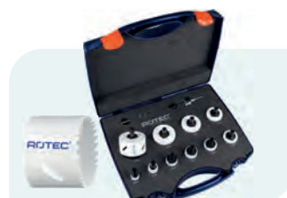
13-dlg. BiMCo8 gatzagenset (4/6) met Quick-Change "Elektricien" 6-knt. 11 Type 527 1x ø22, 27, 32, 35, 38, 44, 51, 60, 68 en 76mm