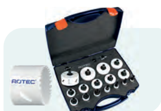
19-dlg. BiMCo gatzagenset (4/6) met Quick-Change "MAX" 6-knt. 11 Type 527 1x ø19, 22, 25, 29, 32, 35, 38, 44, 51, 57, 60, 64, 68, 76, 83 en 92mm