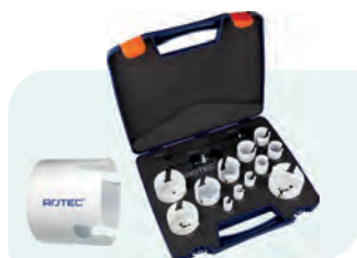
14-dlg. MP-gatzagenset met Quick-Lock "Allround" Type 528 1x ø19, 22, 25, 32, 35, 38, 44, 51, 57, 64, 68 en 76mm