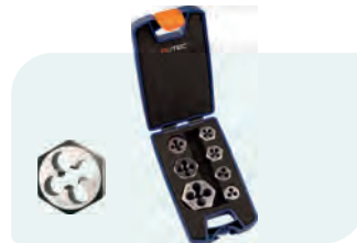
7-dlg. snijmoerset, metrisch [M], in ABS-cassette, Type 370 1x M3, M4, M5, M6, M8, M10 en M12