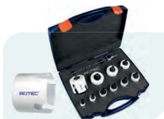
13-dlg. MP-gatzagenset met Quick-Change "Elektricien" 6-knt. 11 Type 528 1x ø22, 27, 32, 35, 38, 44, 51, 60, 68 en 76mm