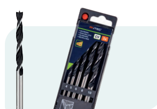
5-dlg. houtspiraalborenset in PVC-cassette Type 235 1x \phi 4, 5, 6, 8 en 10mm