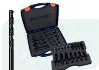
202-dlg. HSS-R spiraalborenset in kunststof koffer Type 100 10x \phi 1 - 8 / 0,5\text{mm} oplopend; 5x \phi 8,5 - 10 / 0,5\text{mm} oplopend; 2x \phi 10,5 - 13 / 0,5\text{mm} oplopend; 10x Tapmaten \phi 3,3 en 4,2\text{mm}