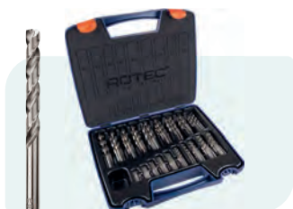
170-dlg. HSS-G spiraalborenset in kunststof koffer Type 105, geslepen 10x \phi 1 - 8 / 0,5\text{mm} oplopend 5x \phi 8,5 - 10 / 0,5\text{mm} oplopend