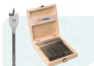
13-dlg. speedborensset in houten kist Type 230 1x ø6, 8, 10, 12, 13, 14, 16, 18, 19, 20, 22, 24 en 25mm