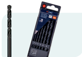
6-dlg. HSS-R spiraalborenset in PVC-cassette Type 100, rolgewalst 1x \phi 2, 3, 4, 5, 6 en 8mm