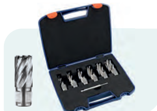
7-dlg. HSS kernborensset SILVER-LINE 30mm (Weldon), in kunststof koffer Type 536W 1x ø12, 14, 16, 18, 20 en 22mm