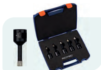
5-dlg. M14 diamantboorkronen-set met wax, in kunststof koffer Type 757 1x ø6, 8, 10, 12 en 14mm