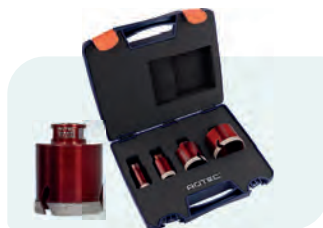
4-dlg. M14 diamantboorkronen-set, PREMIUM, in kunststof koffer Type 757 1x ø25, 35, 50 en 68mm