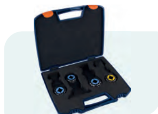
4-dlg. Starlock invalzaag-bladenset (hout en metaal) Type 519 1x 519.0156; 1x 519.0178; 1x 519.0158; 1x 519.0166