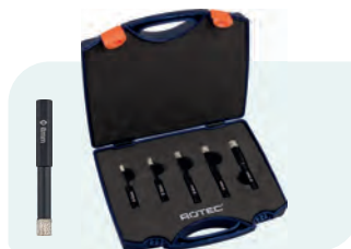
5-dlg. diamanttegelsborensset met wax, in kunststof koffer Type 758.3 1x ø5, 6, 8, 10 en 12mm