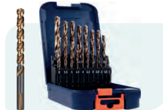
19-dlg. HSS-G spiraalborenset in ABS-cassette Type 107, geslepen 1x \phi 1 - 10 / 0,5\text{mm} oplopend