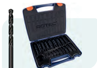
170-dlg. HSS-R spiraalborenset in kunststof koffer Type 100, rolgewalst 10x \phi 1 - 8 / 0,5\text{mm} oplopend 5x \phi 8,5 - 10 / 0,5\text{mm} oplopend