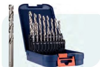
19-dlg. HSS-G spiraalborenset in ABS-cassette Type 105, geslepen 1x \phi 1 - 10 / 0,5\text{mm} oplopend