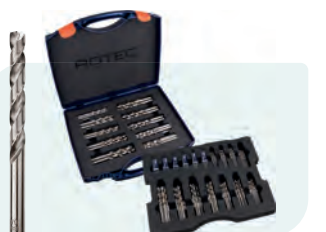
202-dlg. HSS-G spiraalborenset in kunststof koffer Type 105 10x \phi 1 - 8 / 0,5\text{mm} oplopend; 5x \phi 8,5 - 10 / 0,5\text{mm} oplopend; 2x \phi 10,5 - 13 / 0,5\text{mm} oplopend; 10x Tapmaten \phi 3,3 en 4,2\text{mm}