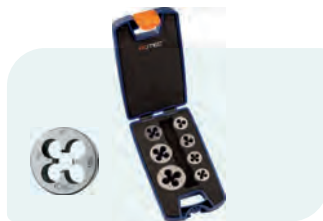
7-dlg. HSS snijplatenset, metrisch [M], in ABS-cassette Type 360 1x M3, M4, M5, M6, M8, M10 en M12