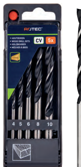
5-dlg. houtspiraalborenset in PVC-cassette Type 235 1x \varnothing 4, 5, 6, 8 en 10mm