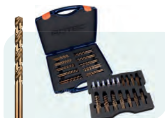
202-dlg. HSS-E spiraalborenset in kunststof koffer Type 111 10x \phi 1 - 8 / 0,5\text{mm} oplopend; 5x \phi 8,5 - 10 / 0,5\text{mm} oplopend; 2x \phi 10,5 - 13 / 0,5\text{mm} oplopend; 10x Tapmaten \phi 3,3 en 4,2\text{mm}