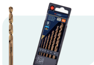
6-dlg. HSS-E spiraalborenset in PVC-cassette Type 116, geslepen 1x \phi 2, 3, 4, 5, 6 en 8mm