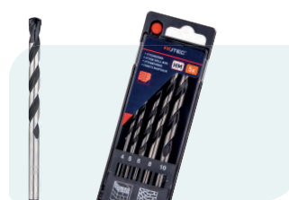
5-dlg. steenborenset in PVC-cassette Type 225 1x \phi 4, 5, 6, 8 en 10mm