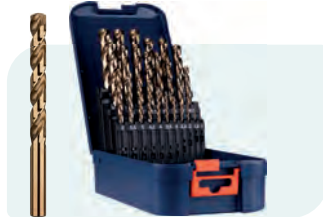
25-dlg. HSS-E spiraalborenset in ABS-cassette Type 111, geslepen 1x \phi 1 - 13 / 0,5\text{mm} oplopend