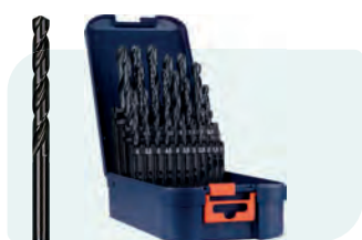
25-dlg. HSS-R spiraalborenset in ABS-cassette Type 100, rolgewalst 1x \phi 1 - 13 / 0,5\text{mm} oplopend