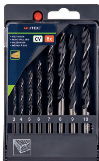
8-dlg. houtspiraalborenset in PVC-cassette Type 235 1x \varnothing 3, 4, 5, 6, 7, 8, 9 en 10mm