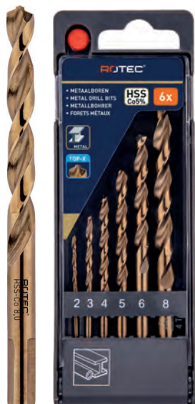
6-dlg. HSS-E spiraalborenset in PVC-cassette Type 116, geslepen 1x \varnothing 2, 3, 4, 5, 6 en 8mm