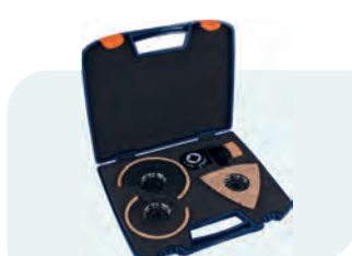
4-dlg. Starlock tegelset "Professional" (HM-Riff) Type 519 1x 519.0280; 1x 519.0146; 1x 519.0260; 1x 519.0270