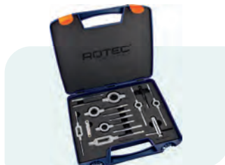
45-dlg. handtap- en snijplaatset, metrisch [M] in kunststof koffer M3, M4, M5, M6, M8, M10 en M12