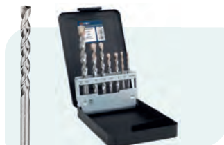
7-dlg. Super-betonborenset in metalen cassette Type 220 1x ø4, 5, 8, 10 en 12; 2x ø6