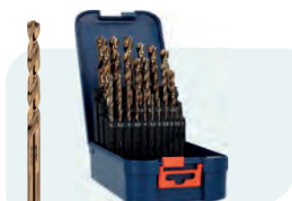
25-dlg. HSS-E spiraalborenset in ABS-cassette Type 116, geslepen 1x \phi 1 - 13 / 0,5\text{mm} oplopend