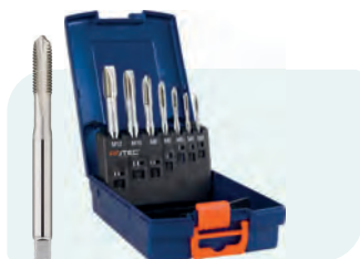
7-dlg. HSS-E OPTI-LINE machine- tappenset, doorlopend, in ABS- cassette Type 'OPTI' (320): DIN 371: M3 - M10; DIN 376: M12