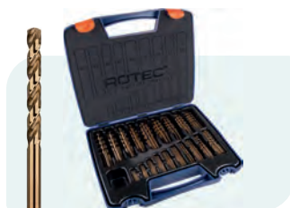
170-dlg. HSS-E spiraalborenset in kunststof koffer Type 111, geslepen 10x \phi 1 - 8 / 0,5\text{mm} oplopend 5x \phi 8,5 - 10 / 0,5\text{mm} oplopend