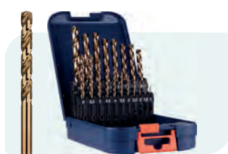
19-dlg. HSS-E spiraalborenset in ABS-cassette Type 111, geslepen 1x \phi 1 - 10 / 0,5\text{mm} oplopend