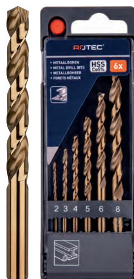
6-dlg. HSS-E spiraalborenset in PVC-cassette Type 111, geslepen 1x \varnothing 2, 3, 4, 5, 6 en 8mm