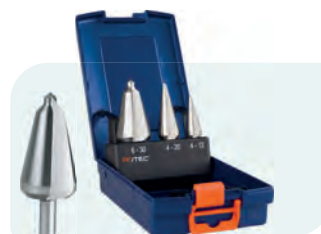
3-dlg. conische plaatborenset in ABS-cassette Type 420 1x Nr. 1, 2 en 3