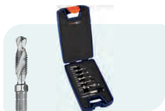
7-dlg. HSS-G combi-boor-tapbitset in ABS-cassette Type 316 1x M3, M4, M5, M6, M8 en M10 + bithouder