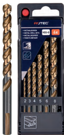
6-dlg. HSS-G spiraalborenset in PVC-cassette Type 107, geslepen 1x \varnothing 2, 3, 4, 5, 6 en 8mm