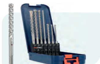
7-dlg. hamerborenset, SDS-plus, QUATTRO-X, in ABS-cassette Type 202 1x ø5, 6 en 8x115; ø6, 8, 10 en 12x165