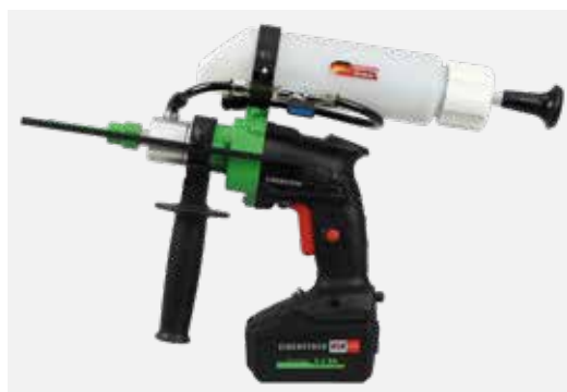
Accu tegelboormachine END 40A Artikelnr. 10.093.12