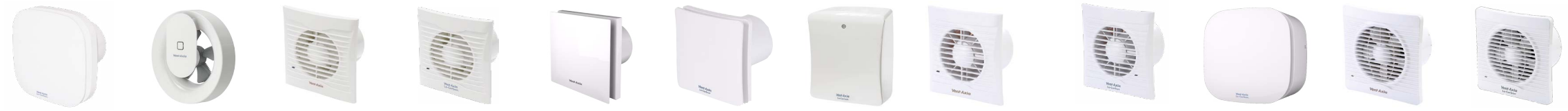
SERENE SVARA AZUR SVELTE MUTE SYLPH SCALA PLUS AZUR SVELTE REVIVE AZUR SVELTE